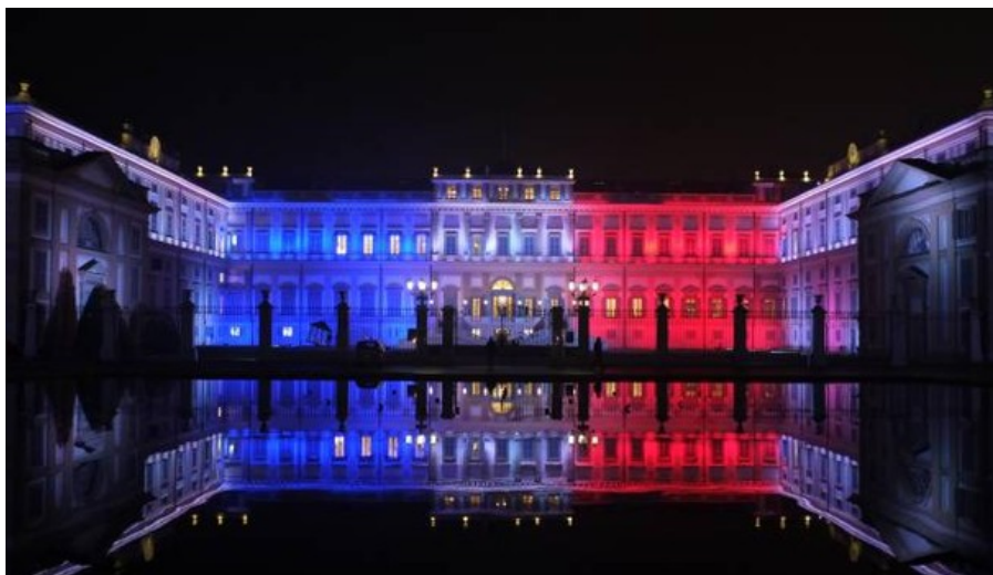
La Villa Reale francese